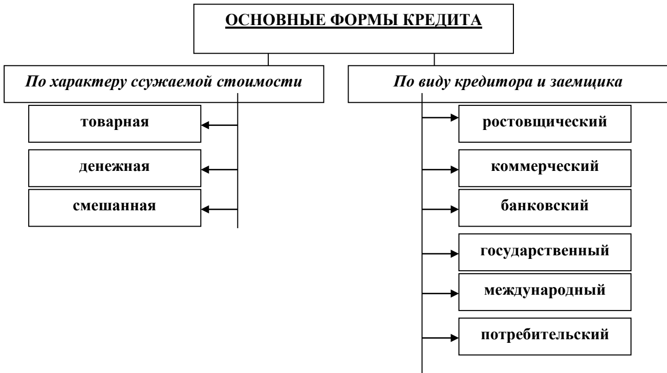
Рисунок 1.1.1 - Классификация основных форм кредита

(где «первая» цифра «1» - номер главы, «вторая» цифра «1» - номер параграфа, «третья» цифра «1» - номер рисунка в главе по порядку)